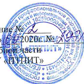
ГРАФИК РАБОТЫ В первом семестре 2021-2022 учебного года мастерской № 321 «IT решения для бизнеса на платформе 1С Предприятие 8» в ГБПОУ «ПТПИТ»

Приложение № 2 к приказу от « 30 » 09 2020 г. № 109/20 по учебной части ГБПОУ «ПТПИТ»