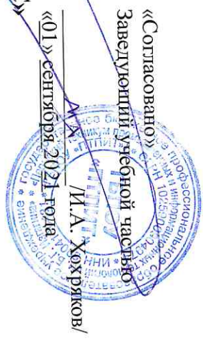
График работы мастерской № 321 «IT решения для бизнеса на платформе 1С» с «01» сентября 2021г. по «31» декабря 2021г.