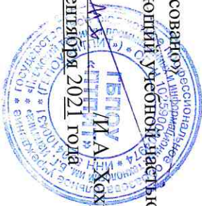
График работы мастерской № 321 «IT решения для бизнеса на платформе 1С» с «01» сентября 2021г. по «31» декабря 2021г.