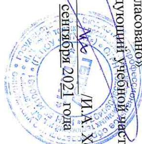
График работы мастерской № 321 «IT решения для бизнеса на платформе 1С» с «01» сентября 2021г. по «31» декабря 2021г.