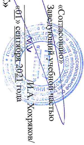
График работы мастерской № 321 «IT решения для бизнеса на платформе 1С»

с «01» сентября 2021г. по «31» декабря 2021г.