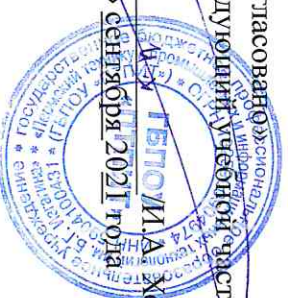
График работы мастерской № 321 «IT решения для бизнеса на платформе 1С»

с «01» сентября 2021г по «31» декабря 2021г.