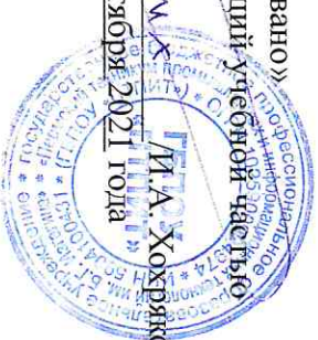
График работы мастерской № 321 «IT решения для бизнеса на платформе 1С»

с «01» сентября 2021г. по «31» декабря 2021г.