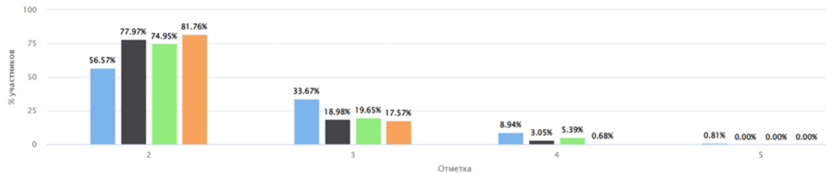
Общая гистограмма отметок