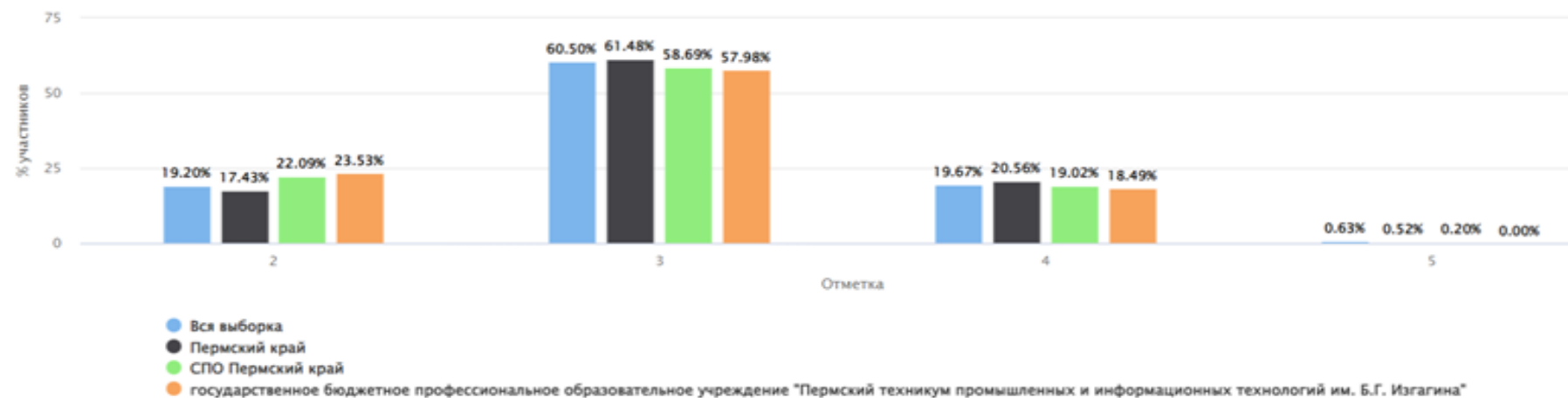
Общая гистограмма отметок