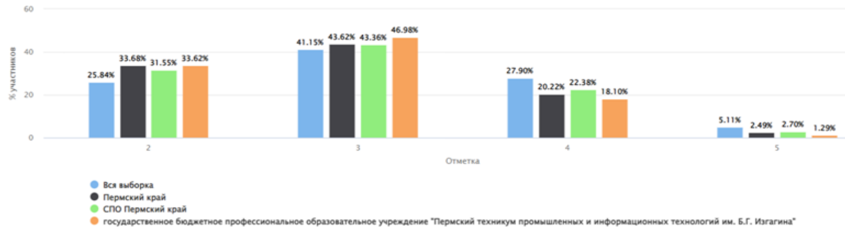
Общая гистограмма отметок